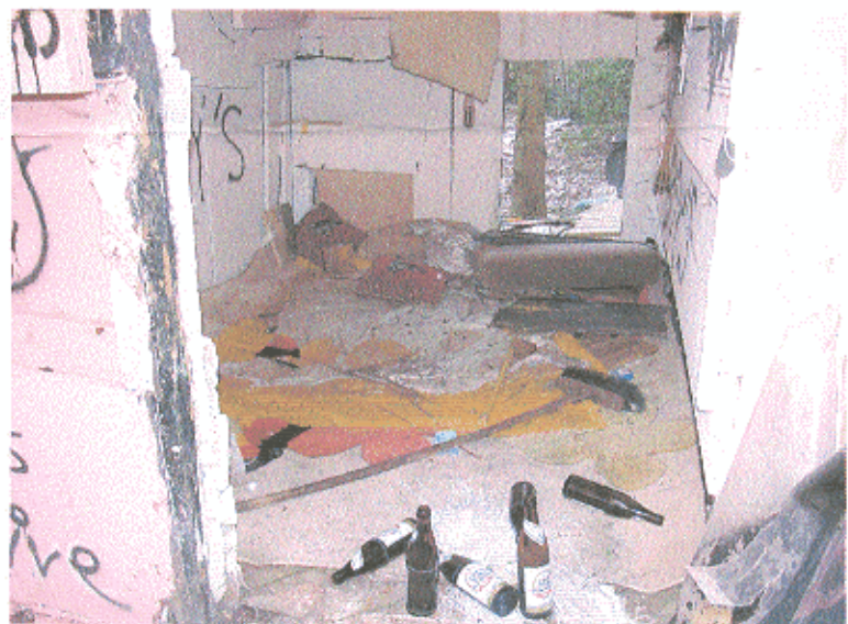
..... aber wie?