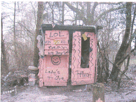
Wird noch genutzt (?)....