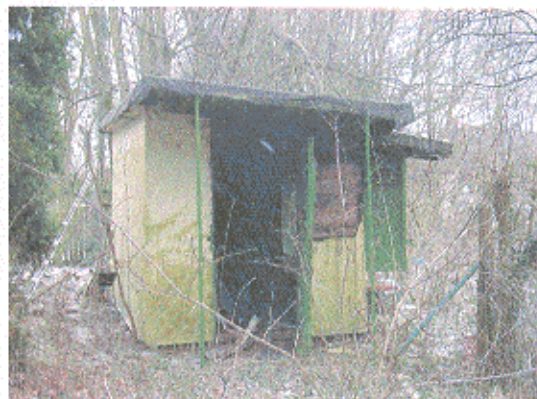
Ansicht spricht für sich.