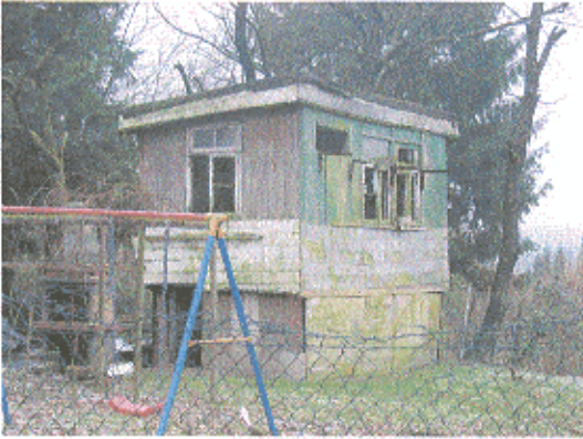
Wohl kaum noch genutzt.