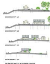
Geländeschnitte (ohne Maßstab)