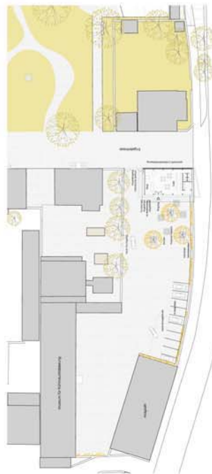
Historisches Zentrum mit Parkieren M: 1:200