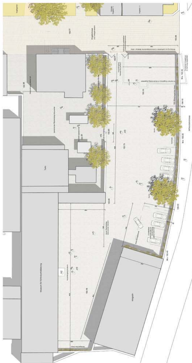
Grundriss historisches Zentrum M: 1:100