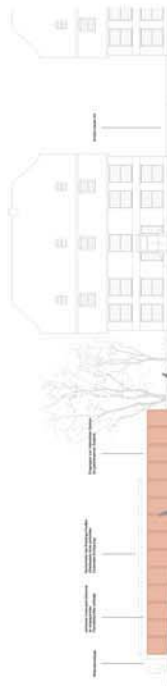
Ansicht des historischen Gebäudes von der Engländerstraße M: 1:100