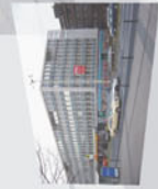
4 ehemaliger Standort Thalia Theater