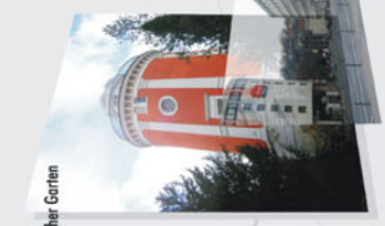
2 Botanischer Gärten