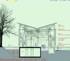
Pflanzenbahnhof Schnitt M 1:100