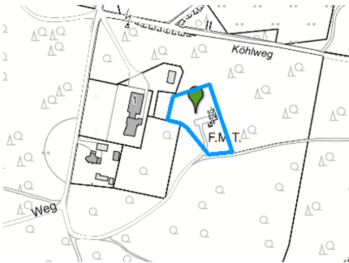
Anlage 3 – Lageplan Maststandort südlich Köhlweg