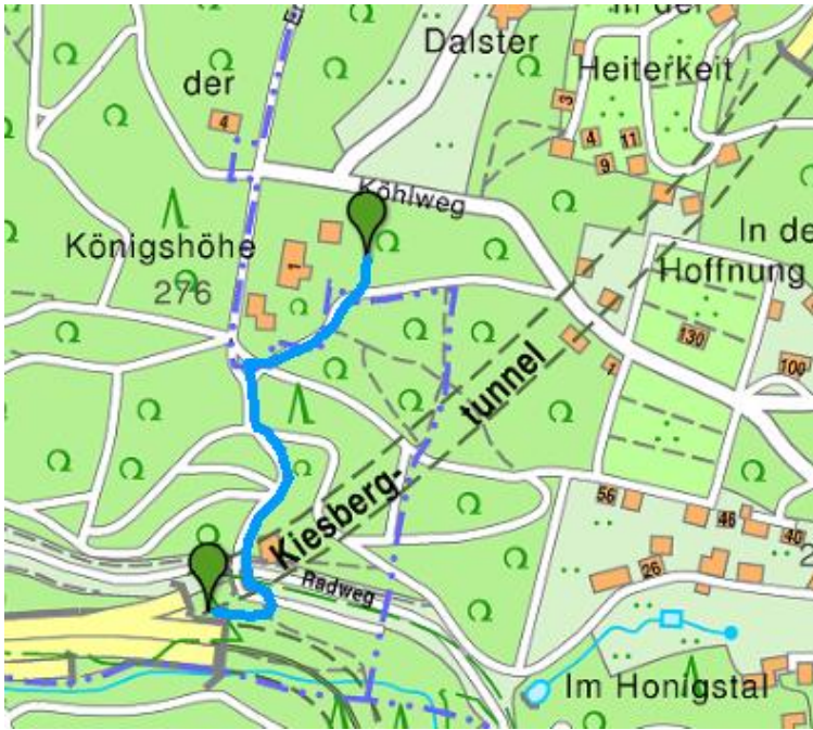
Anlage 1 - Übersichtslageplan der beiden Maststandorte mit dem geplanten Leitungsverlauf