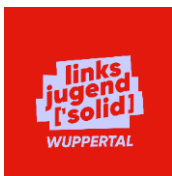
Linksjugend [solid] Wuppertal