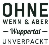
Ohne Wenn & Aber