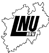
LNU Kreis Wuppertal