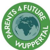
Parents for Future Wuppertal