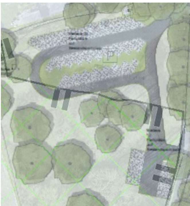
Außenanlagenplan verschnitten mit dem Schutzgebiet