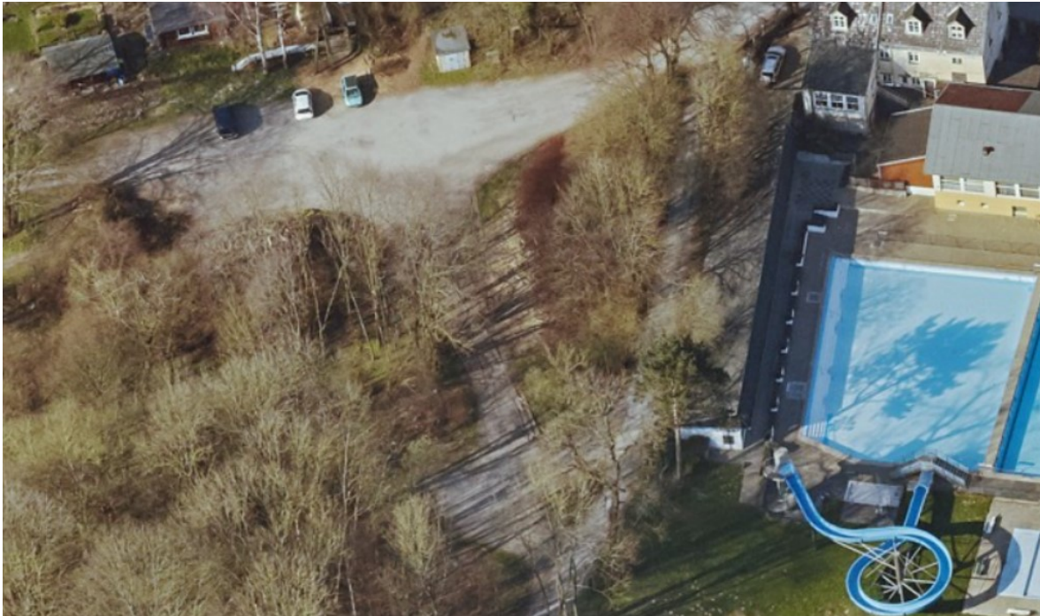
Schrägluftbild der Parkplatzfläche aus 2020