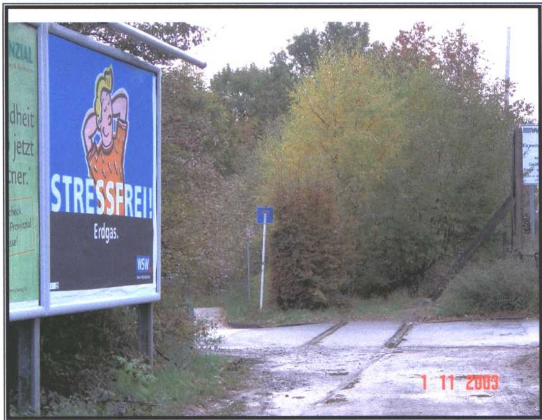
Im Bereich Vonkeln ist die Trasse zugewachsen ... wie auch im Bereich Neuenhof...