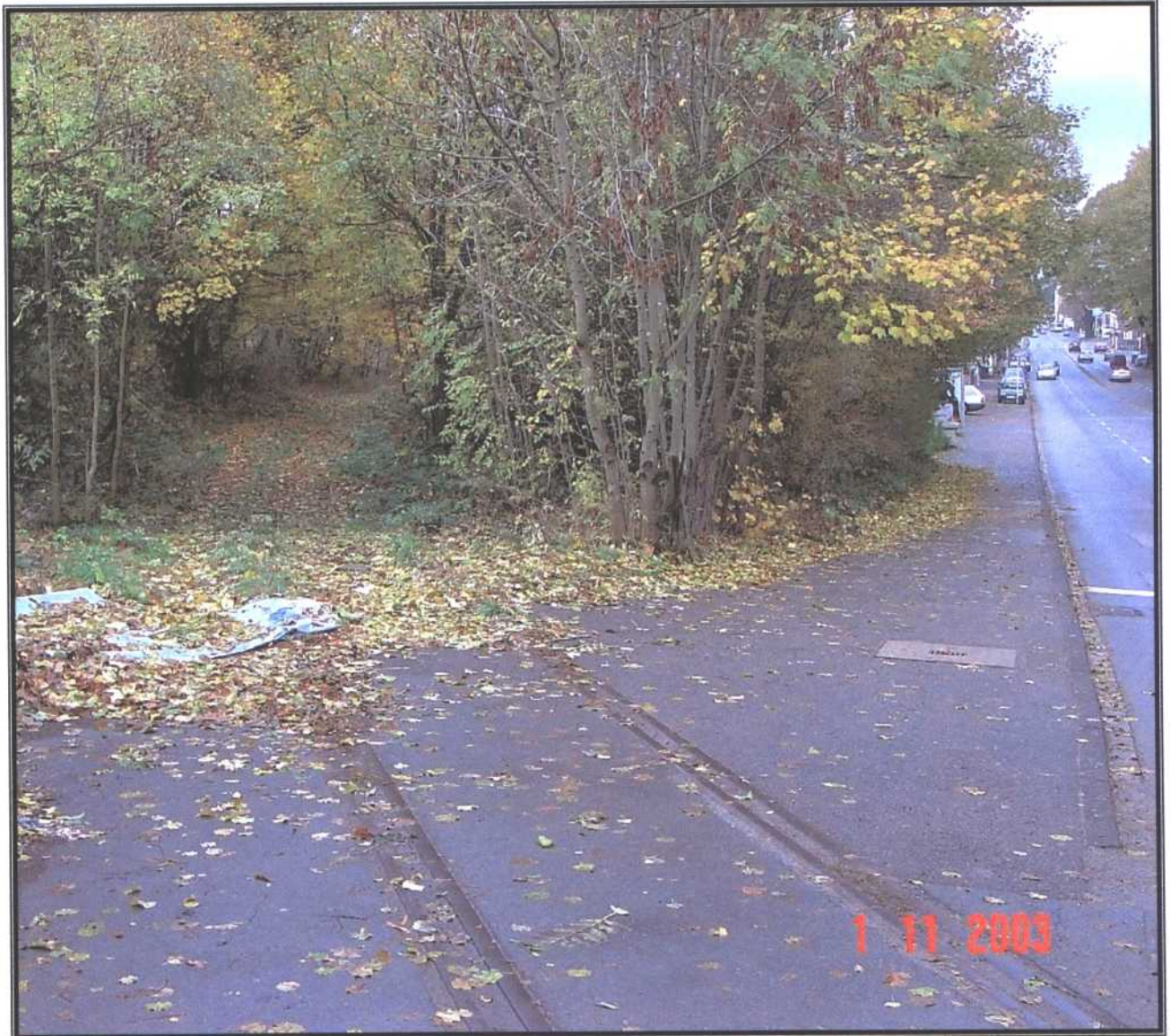
Bahnübergang an der Hauptstraße Die Natur holt sich die Trasse zurück.