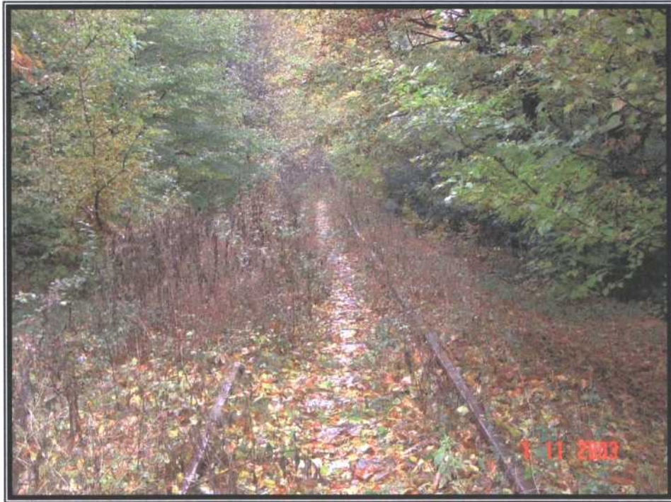
Hinter dem Bahnhof Küllenhahn wächst die Strecke immer mehr zu... ... bis sie in Höhe der Gaststätte Burgholz ganz zu ist.