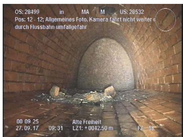
Abb. 2: Stahlplatte vor bzw. an dem Schacht 28532

Der Kanal im Glockenprofil DN 1100/1200 MA endet mit einer Stahlplatte vor dem vorh. Schacht 28532 (mit Seiteneinstieg).