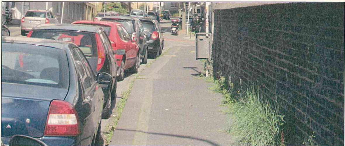
Abb. 3: mit Sperrung der B7 eingerichtete Parkmöglichkeiten am nördlichen Fahrbahnrand der Adersstraße

Die vorgenannten Ursprungszustände sind in der bisherigen Diskussion um die Verkehrsführung in der Südstadt und zur Parkraumbilanz leider völlig ignoriert bzw. vergessen worden.