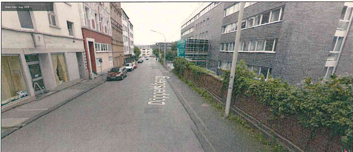
Abb. 1: komplettes Halteverbot am Fahrbahnrand der Dessauerstraße in Richtung B7 vor der Sperrung der Straße Döppersberg (Aufgenommen August 2008)

Im Vergleich zum verkehrlichen Zustand vor dem Umbau des Döppersberg sind keine Parkplätze in der Südstadt entfallen, sie verteilen sich allerdings anders. Während in der Vereinsstraße weniger Parkplätze vorhanden sind als vor dem Umbau, sind es in der Dessauerstraße mehr Parkplätze als vorher. Der in der medialen Berichterstattung und auch im Bürgerantrag zur Änderung des Südstadtkonzeptes entstandene Eindruck, dass Parkraum reduziert wurde, ist in Bezug auf den ursprünglichen baustellenfreien Zustand abseits emotionaler Gesichtspunkte unter Berücksichtigung der Fakten nicht richtig. Die Parkplätze, die beispielsweise mit Umsetzung des Südstadtkonzeptes am Fahrbahnrand der Dessauerstraße entfallen sind, hat es vor der bauzeitlich bedingten Sperrung der Straße Döppersberg zur Gewährleistung des uneingeschränkten Zweirichtungsverkehrs gar nicht gegeben. Sie wurden erst nach deren Sperrung eingerichtet und waren überhaupt nur dadurch und von vornherein als temporärer Parkraum möglich.