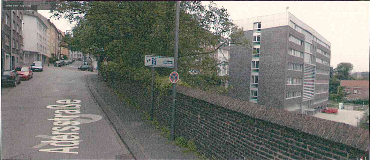
Abb. 2: Halteverbot am nördlichen Fahrbahnrand der Adersstraße vor der Sperrung der B7 (©2018 Google, Aufgenommen August 2008)

Ähnlich verhält es sich im Bereich der Adersstraße. Auch hier wurden erst mit Sperrung der B7 im Juli 2014 und der Einrichtung der Adersstraße als Einbahnstraße Parkplätze in Bereichen des Fahrbahnrandes eingerichtet, die vorher mit einem absoluten Halteverbot beschildert waren.