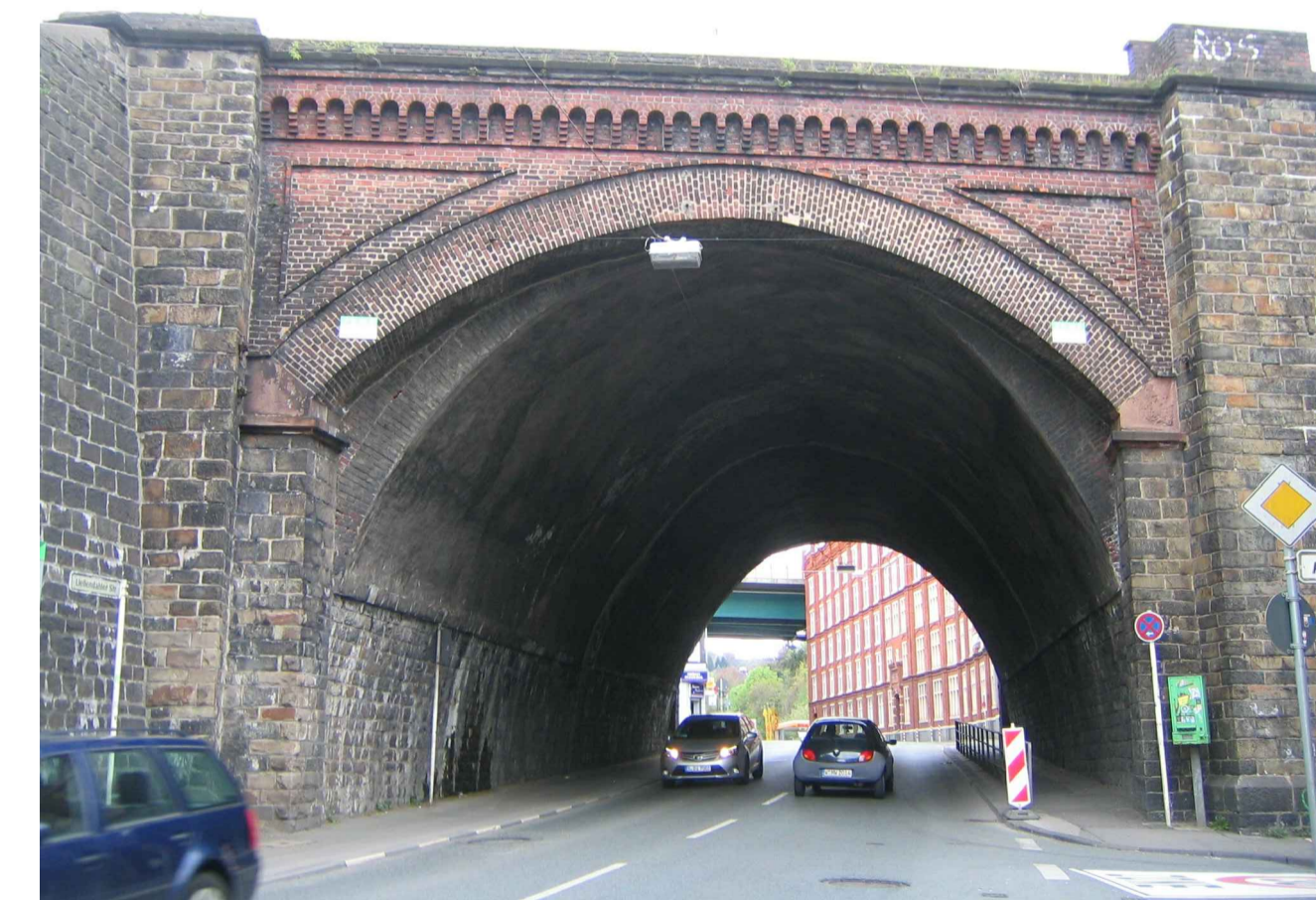
Hinweis: Foto vor Sanierung 1. Ba