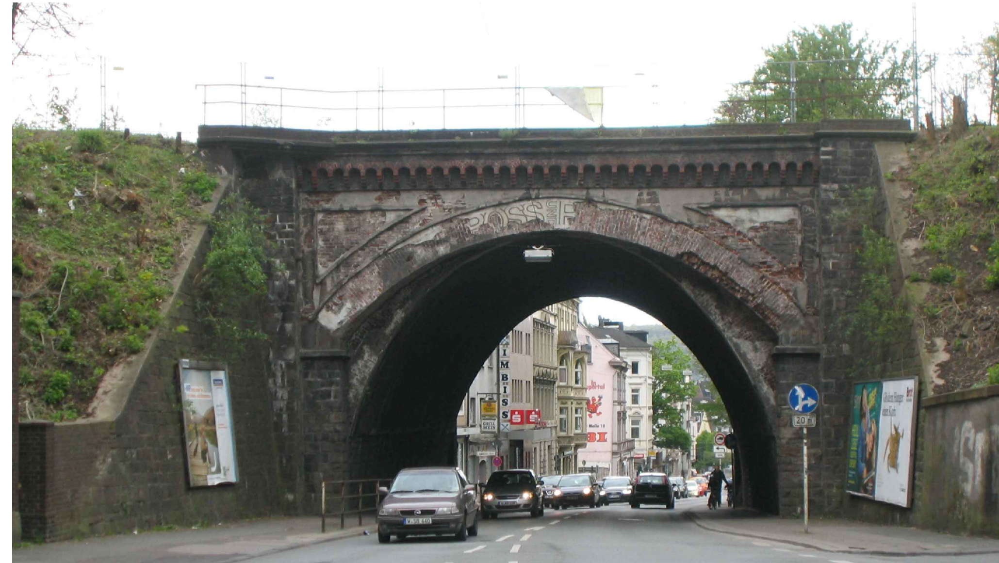
Hinweis: Foto vor Sanierung 1. Ba