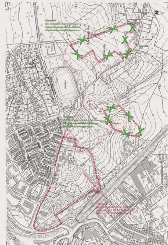
Übersichtskarte Der Geltungsbereich des Bebauungsplanes 772 A besteht aus 3 Teilflächen