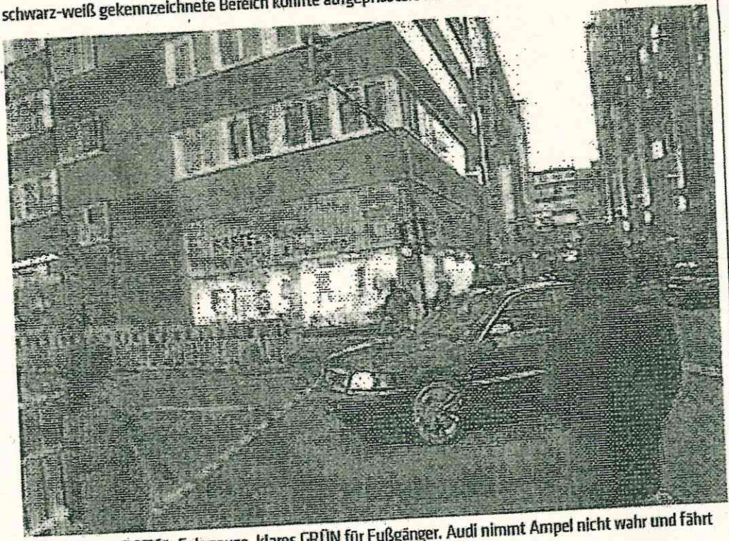
Foto 2: Klares ROT für Fahrzeuge, klares GRÜN für Fußgänger. Audi nimmt Ampel nicht wahr und fährt bei ROT durch.