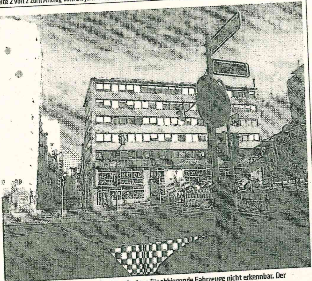
Foto 1: Hofaue, Ecke Morianstraße. Ampelanlage für abbiegende Fahrzeuge nicht erkennbar. Der schwarz-weiß gekennzeichnete Bereich könnte aufgepflastert werden.