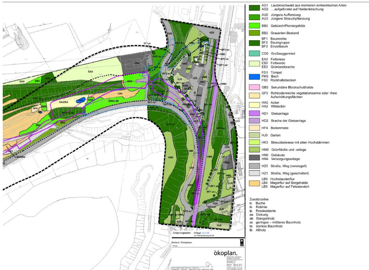
Abb. : Auszug aus dem LBP, Biotoptypen

Schwarz: genehmigte Trasse Violett: 4. Änderungsverfahren Blau: 5. Änderungsverfahren