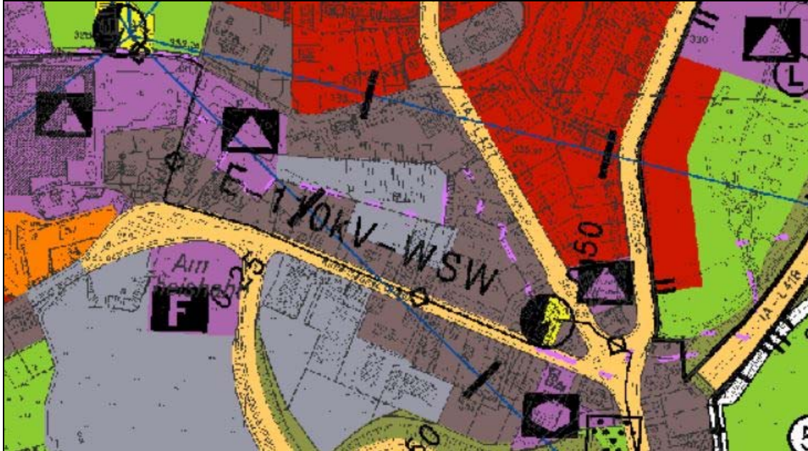
Abb. 2: Flächennutzungsplan

Der Planänderungsbereich ist überwiegend durch gewerbliche Bebauung, deren Nutzung aufgegeben wurde und versiegelte Flächen gekennzeichnet. Lediglich im Westen finden sich Freiflächen.