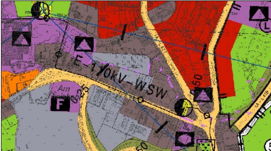
Abb. 2: Flächennutzungsplan

Der Planänderungsbereich ist überwiegend durch gewerbliche Bebauung, deren Nutzung aufgegeben wurde und versiegelte Flächen gekennzeichnet. Lediglich im Westen finden sich Freiflächen.