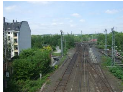
Blick von der Brücke Spitzenstraße.