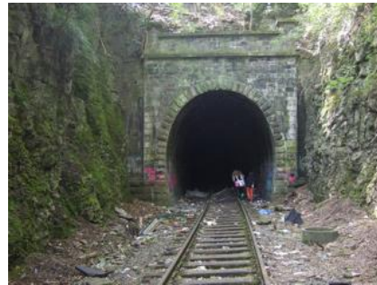
Tunnel zwischen Langerfeld und Wichlinghausen – Tunnelmund Dahler Str..