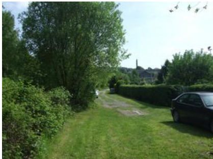
Verbindungsstück Tunnel S-Bahnhaltepunkt Langerfeld.