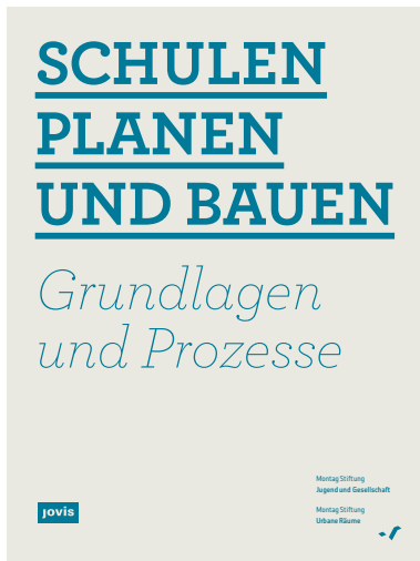
Handbuch „Schulen planen und bauen“ Anfang 2012 bei den Verlagen Jovis und Friedrich erschienen.

Anlass für diesen Wettbewerb ist das Erscheinen des von den Montag Stiftungen herausgegebenen Handbuchs „Schulen planen und bauen. Grundlagen und Prozesse“. Es gibt die Erfahrungen der Stiftungen und ihrer Autoren zur erfolgreichen Gestaltung der Phase Null weiter. Die Autoren sind führende Experten aus den Bereichen Pädagogik, Architektur und Verwaltung mit langjähriger Erfahrung in der Schulentwicklung und dem Planen und Bauen von Schulen. Sie haben ihr Wissen aus zahlreichen erfolgreich durchgeführten Projekten gemeinsam formuliert und zusammengestellt. Der Wettbewerb dient auch dazu, dieses gesammelte Wissen weiter zu verbreiten und in der Schulbaupraxis zu etablieren.