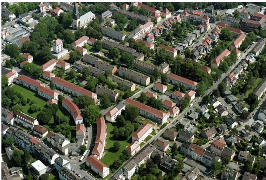
Luftbild 607739 Service Center Reprografie Stadt Wuppertal Ressort 102

Der Geltungsbereich Sedansberg II umfasst ein Gelände nördlich der Schwalbenstraße, westlich der Alarichstraße, südlich der Meisenstraße, westlich der Amselstraße einschließlich der kleinen Parkanlage an der Kirche St. Marien, sowie die Siedlungsstraße vom Anfang bis Nr. 28 bzw. 27 und der Sedanstraße von Nr. 104 bis Nr. 132. Ausgenommen ist hiervon der Bereich der zweigeschossigen Doppelhäuser Meisenstraße 10 bis 28 sowie Theoderichstraße 31 bis 53 und 30 bis 52. Die Boelckestraße, Totilaweg, Fasanenweg und Spechtweg zählen vollständig zum Siedlungsgebiet (die genaue Abgrenzung ist dem Übersichtsplan zu entnehmen).