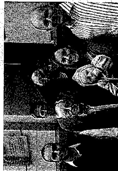
Die Verantwortlichen des Kinder-Tisch Vohwinkel e.V.

Um möglichst sinnvoll und zielführend mit den Kindern zu arbeiten, stehen wir für Eltern, Lehrkräfte oder behördliche Betreuer gerne für Gespräche zur Verfügung. Sie sind jederzeit herzlich eingeladen, sich vor Ort über unsere Arbeit zu informieren.