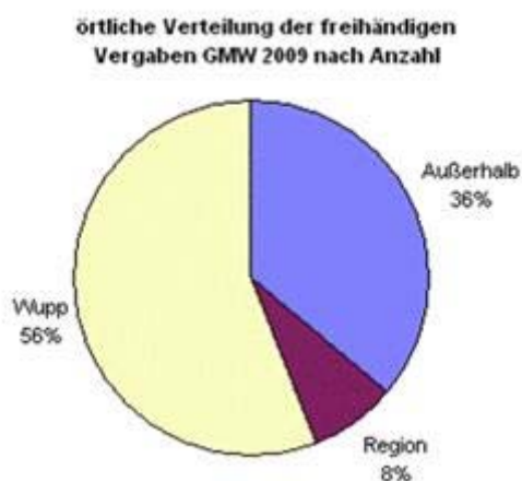
Bild1 öffentliche Verteilung der Vergaben nach Anzahl

Dabei entfielen 64% auf den Bereich Wuppertal mit umliegender Region und 36 % auf andere deutsche Regionen.