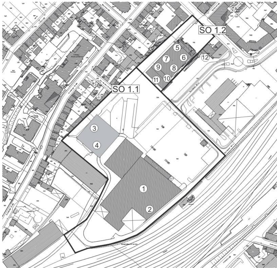
Abb.: Übersicht über vorhandene und geplante Einzelhandelsbetriebe im Bereich der Steinbecker Meile