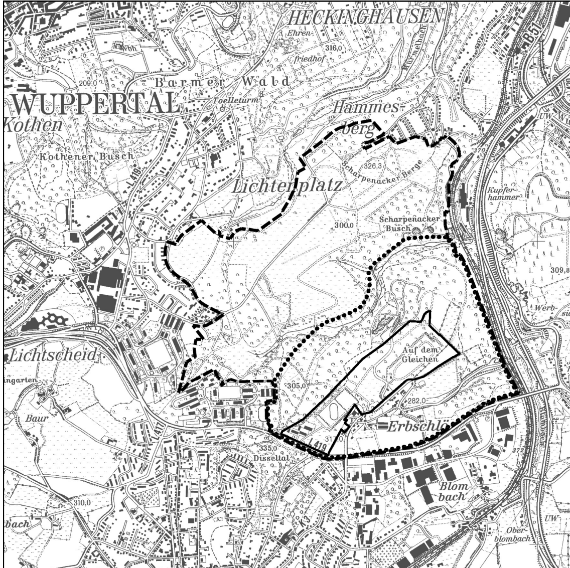
Abb. 1: Abgrenzung des Vorhabensraumes (—), Wirkraumes (•••) und des Gesamt- raumes (- - -)