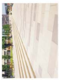
Referenz: Betonstein - Plattenbau