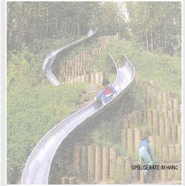
SPIELGERÄTE IM HANG