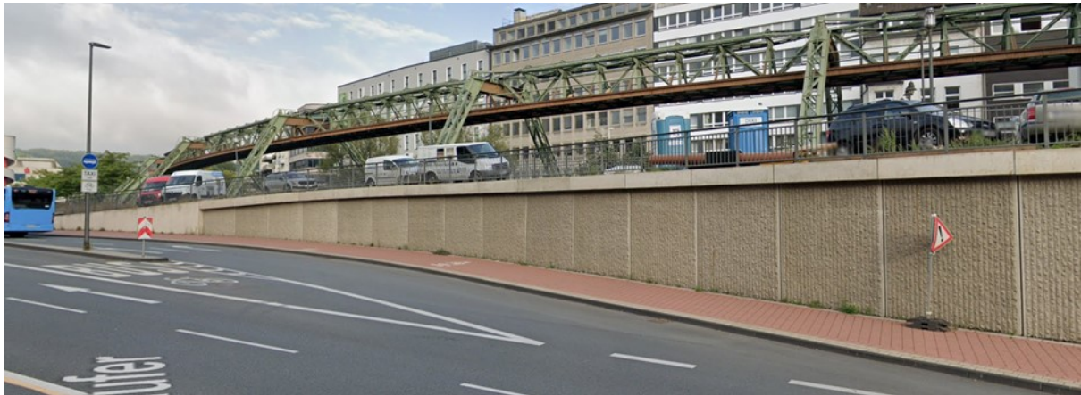
Anlage 1: fehlende Bordsteinabsenkung B7 / Islandufer