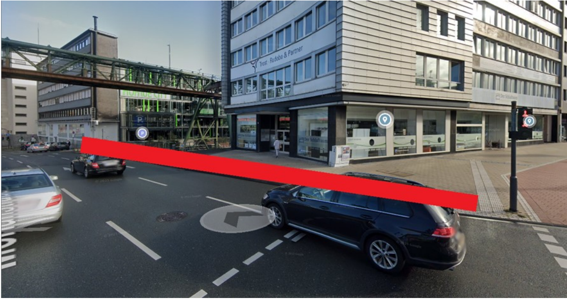
Anlage 2: gewünschte neue Radführung Fahrtrichtung Gathe