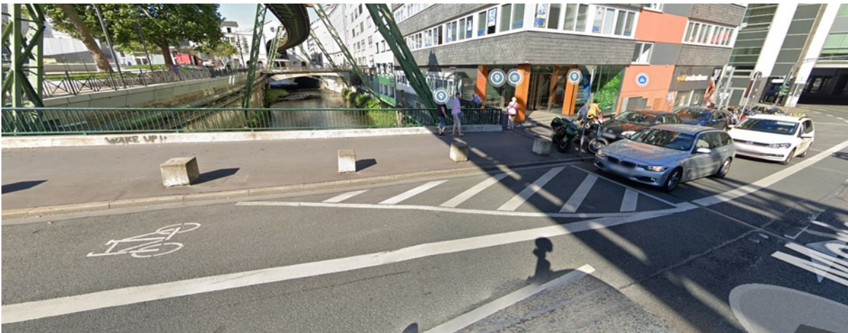
Anlage 3B: aktuelle Situation