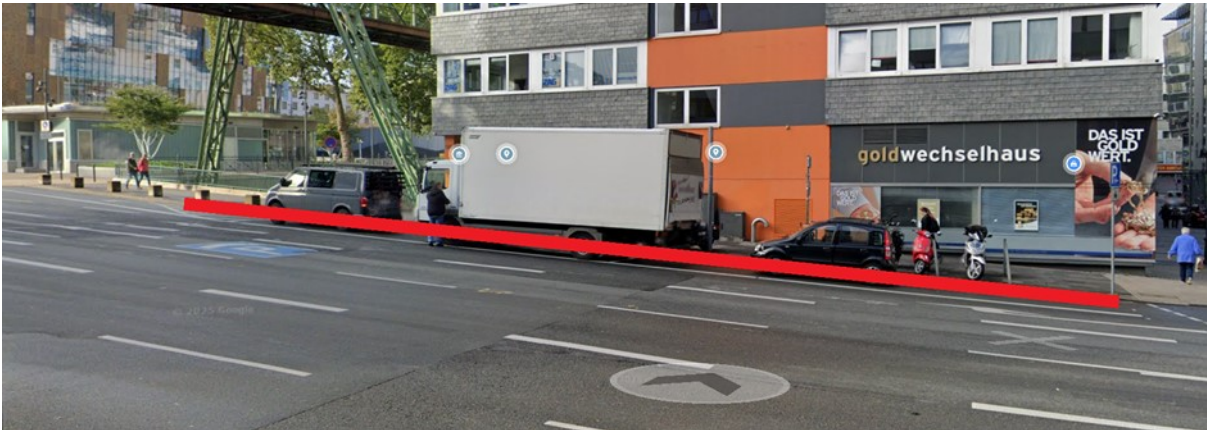
Anlage 3A: gewünschte neue Radführung