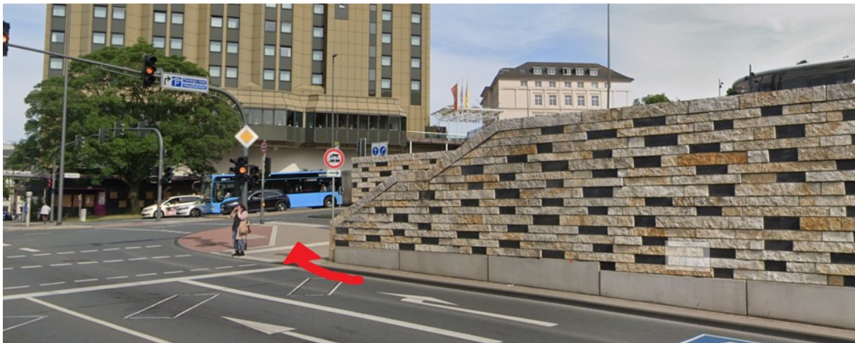
Anlage 5: Gewünschte Radführung