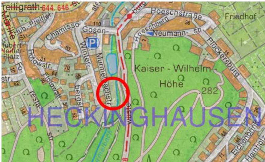
Verortung im Stadtgebiet