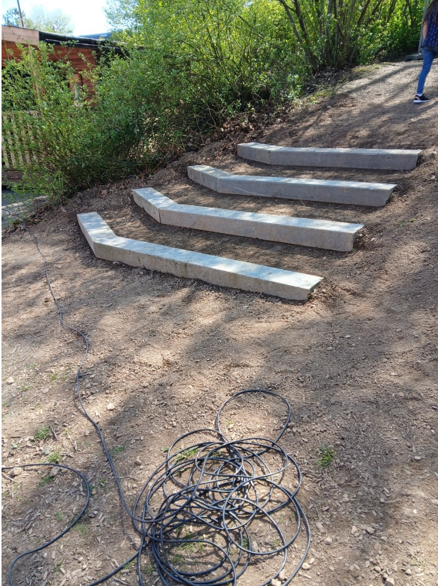
Abbildung 8: GS Fritz-Harkort-Schule (Siegelberg 40) Bahnschwellen