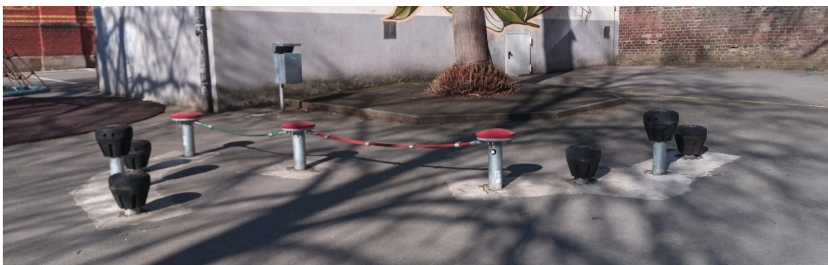
Abbildung 4: Grundschule Marienstraße – Balancierkombination