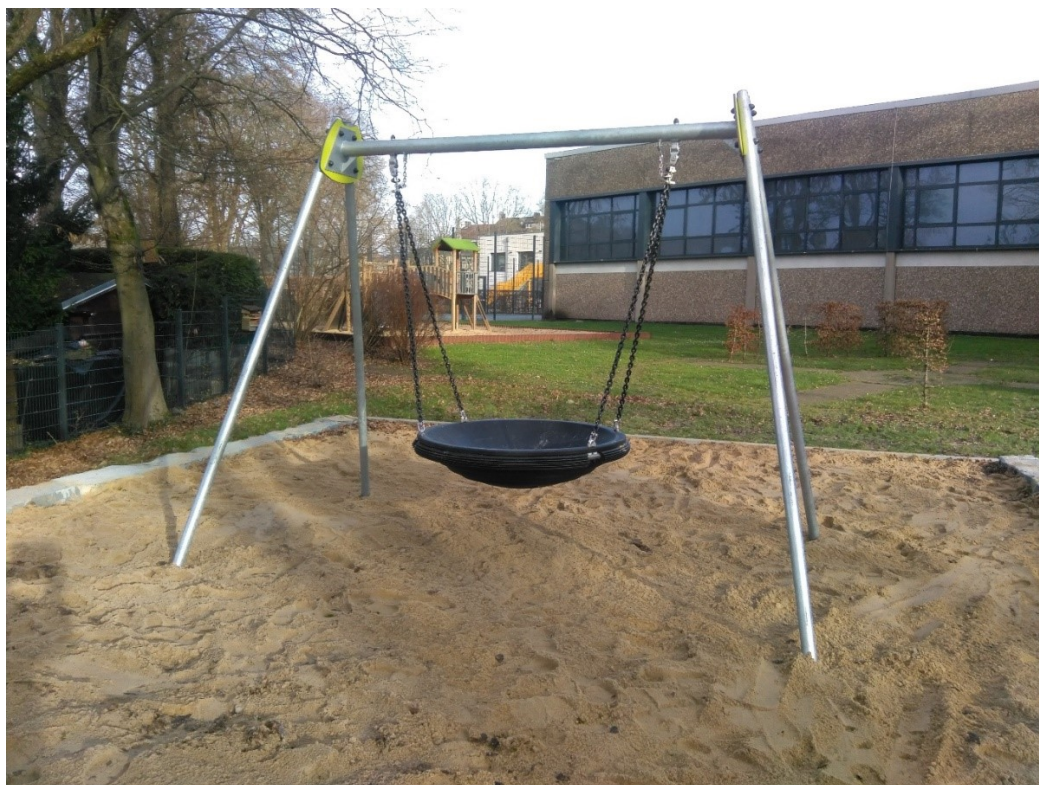
Abbildung 6: GS Thorner Str. – Schaukel