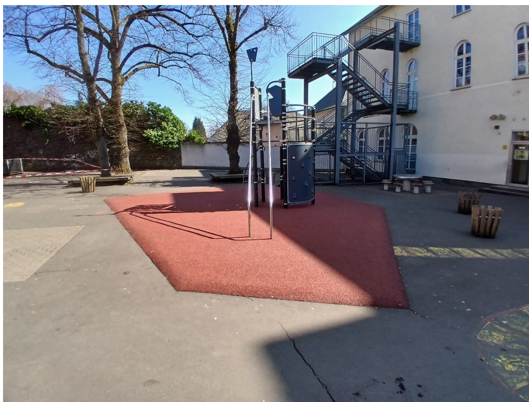
Abbildung 7: GS Friedhofstr. – neuer Gummifallschutz