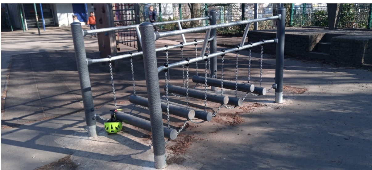
Abbildung 4: Grundschule Marienstraße (Standort Schusterstr.) – Wackelbrücke