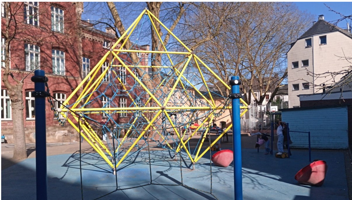
Abbildung 3: Grundschule Markomannenstraße – Fallschutz und Überarbeitung Seilpyramide und Reckstangen