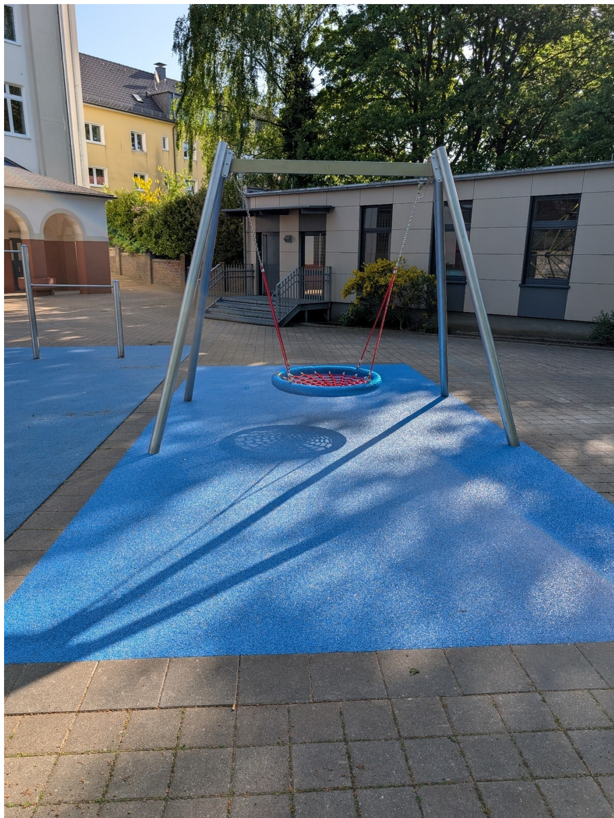
Abbildung 5: Johannes-Rau-Schule, Kreuzstr. 85 – Nestschaukel mit Fallschutz