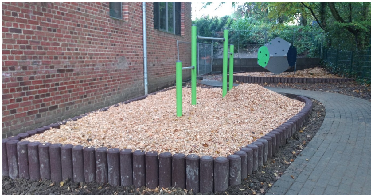
Abbildung 1: Grundschule Kurt-Schumacher-Straße - Spielgeräte und Fallschutz