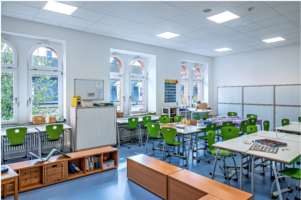
Abbildung 9: Multifunktionale Raumausstattung