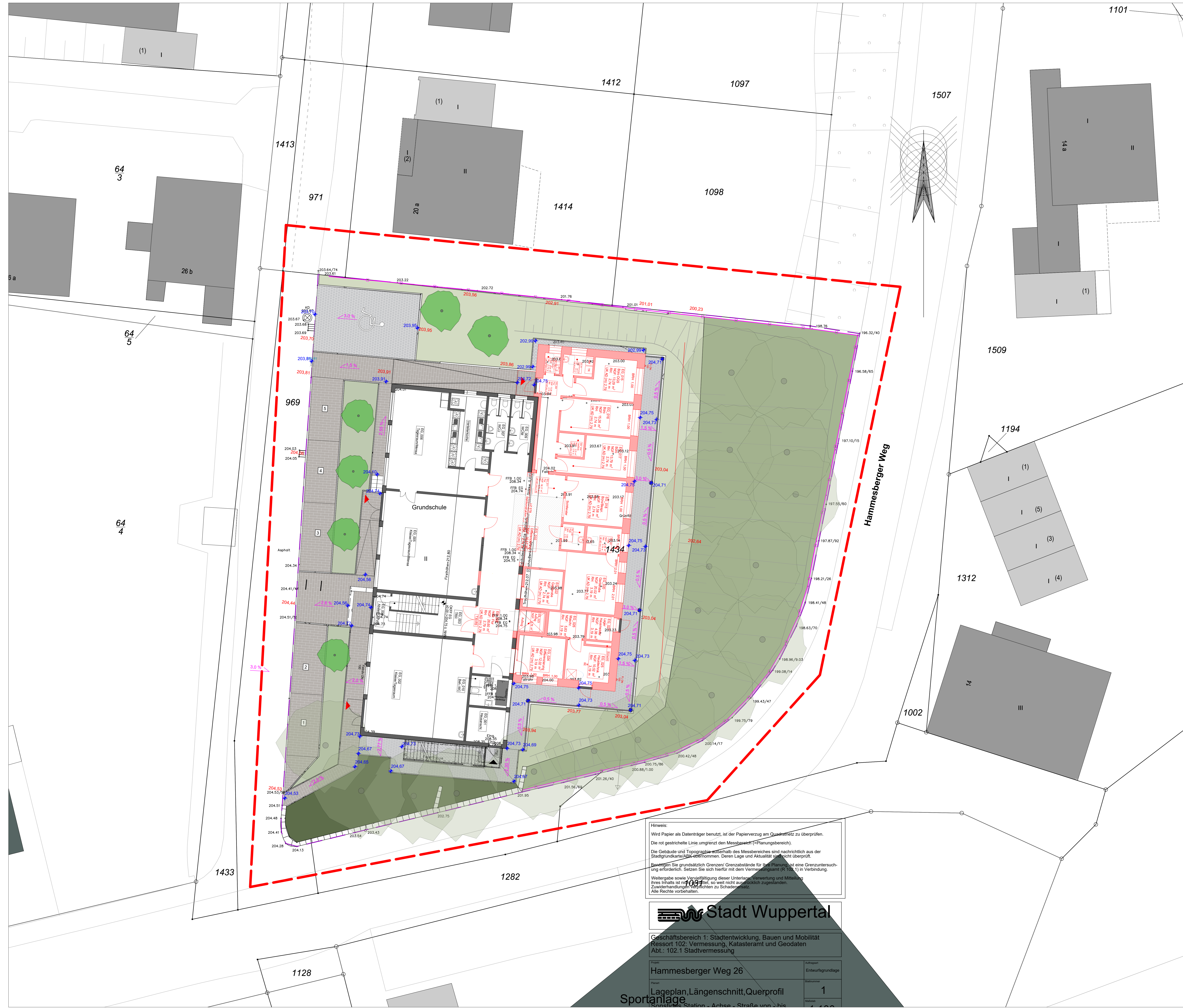
Übersichtsplan | M 1:100

Hinweis: Wird Papier als Datenträger benutzt, ist der Papierverzugs am Quadratnetz zu überprüfen. Die rot gestrichelte Linie umgibt den Messbereich (=Planungsbereich). Die Gebäude und Topographie innerhalb des Messbereiches sind nachträglich aus der Stadtgrundkarte/ABK übernommen. Deren Lage und Aktualität sind nicht überprüft. Berechnen Sie grundsätzlich Grenzen/ Grenzabstände für Ihre Planung, ist eine Grenzuntersuchung erforderlich. Setzen Sie sich hierfür mit dem Vermessungsamt (R 102.1) in Verbindung. Weitergabe sowie Vervielfältigung dieser Unterlage, Verwertung und Mitteilung ihres Inhalts ist nicht zulässig, soweit nicht ausdrücklich zugestanden. Zuwiderhandlungen verpflichten zu Schadenersatz. Alle Rechte vorbehalten.