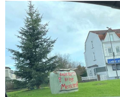
... Blick v Mollenkotten Ri Kreisel