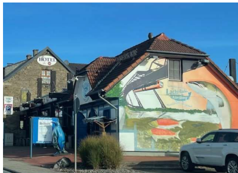
...Blick Schmiedestr. Ri Kreisel