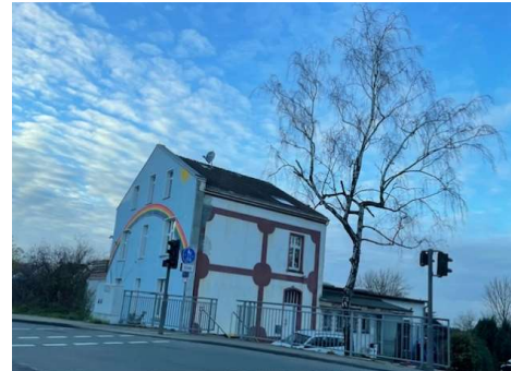
... Blick v Kreisel Ri Mollenkotten