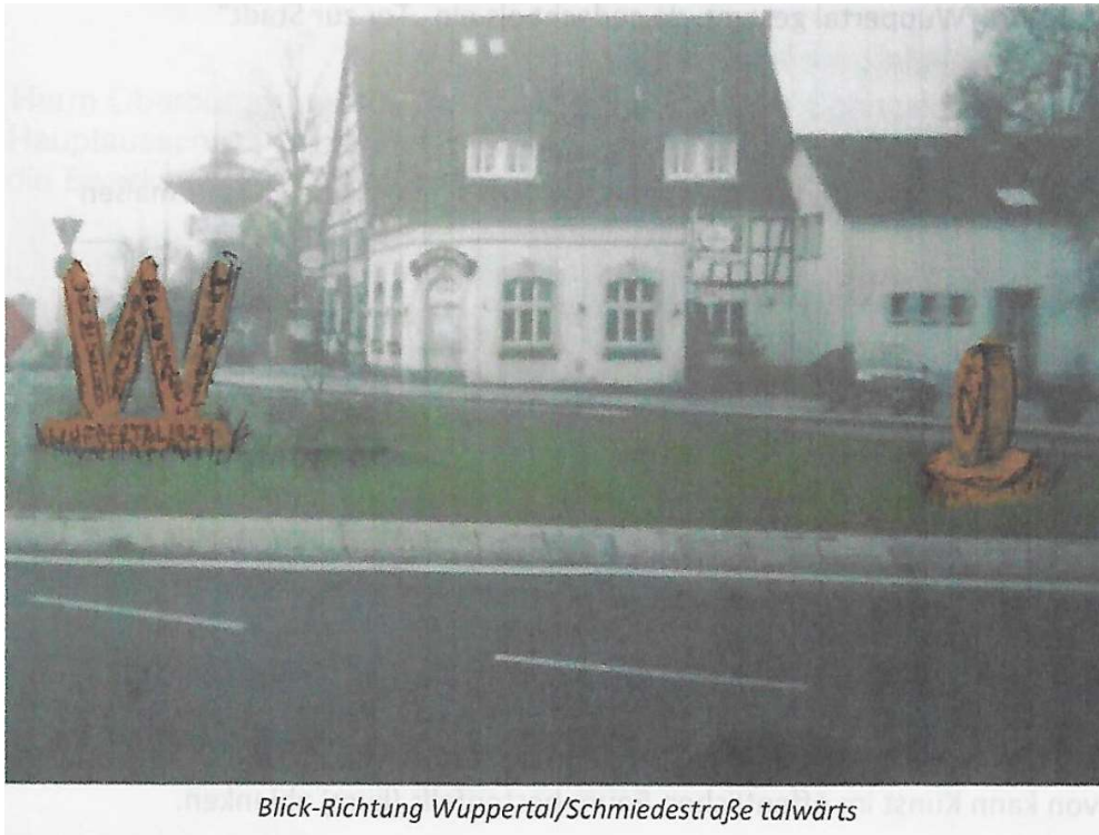
Blick-Richtung Wuppertal/Schmiedestraße talwärts