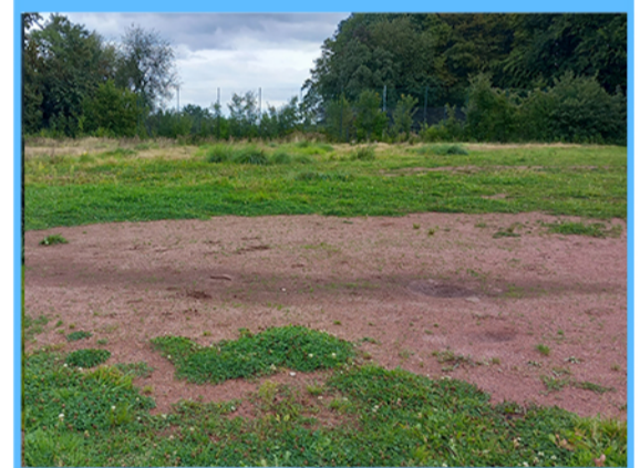
Verbindung „Grüner Finger“