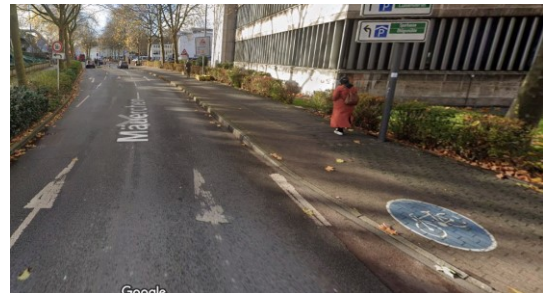
Abbildung 1: Radverkehrsführung in der Straße Mäuerchen

Wie auch in der Kasinostraße wurde die ursprüngliche Benutzungspflicht durch Piktogramme auf dem Radweg verdeutlicht (siehe Abbildung 1). Die Markierung ist aufgrund der nicht richtlinienkonformen Bauweise zu entfernen, sodass der Radverkehr zukünftig nur im Mischverkehr geführt wird. Die zulässige Höchstgeschwindigkeit beträgt außerhalb der Baustellenbereiche 30km/h (Beschluss vom 11.11.2021 im Hauptausschuss mit der Drucksache VO/1188/21).