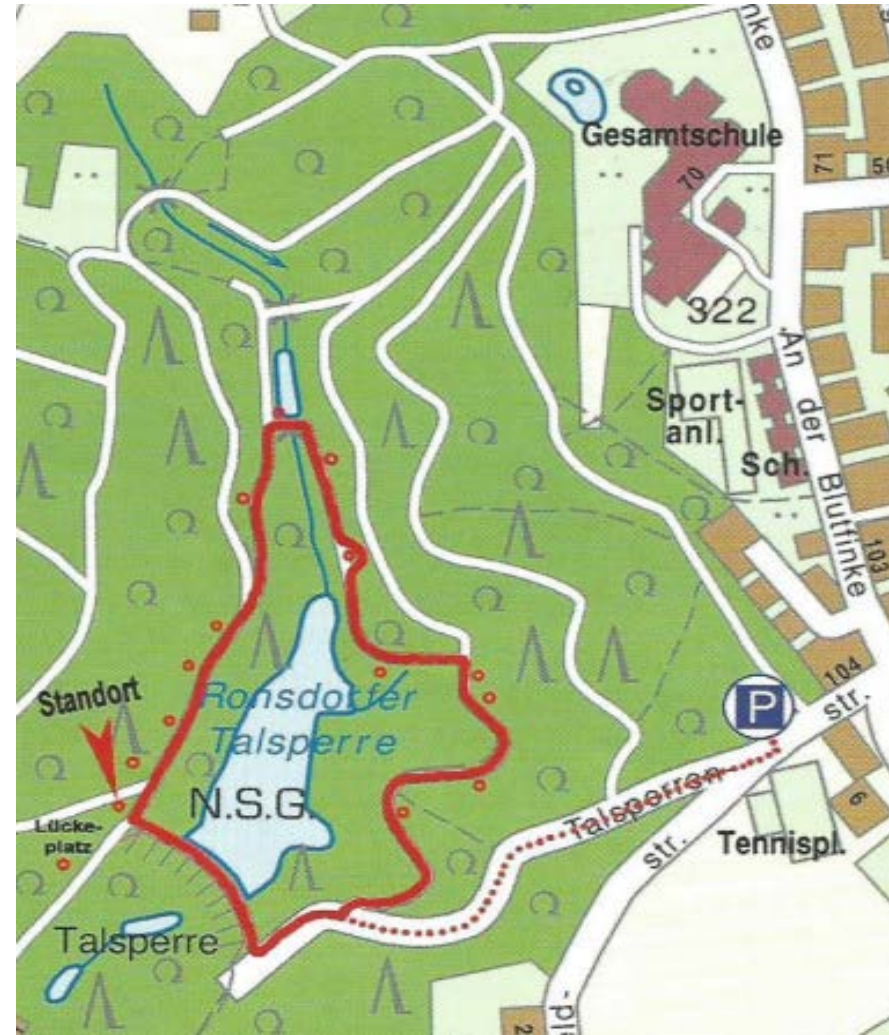
Abbildung 1: Walderlebnisweg um die Talsperre