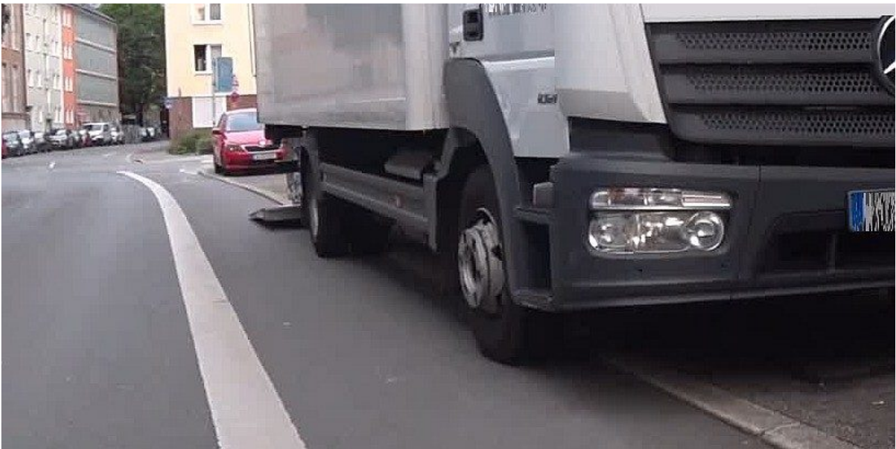
Abb. 1: Laden auf dem Seitenstreifen und Radweg Samstagmorgen kurz nach 6...

Beide Fälle sind mit einer Gefährdung des Radverkehrs verbunden. Daher sollten die Zeiten des eingeschr. Haltverbot auf „Mo-Sa 6-10, 15-18h“ ausgedehnt werden.