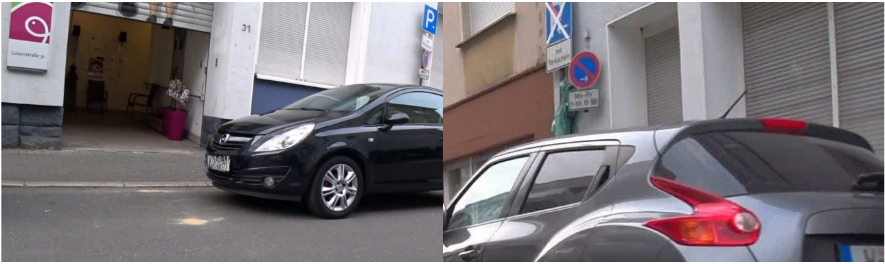
Abb. 2: ... weil das Haltverbot nur montags bis freitags gilt.