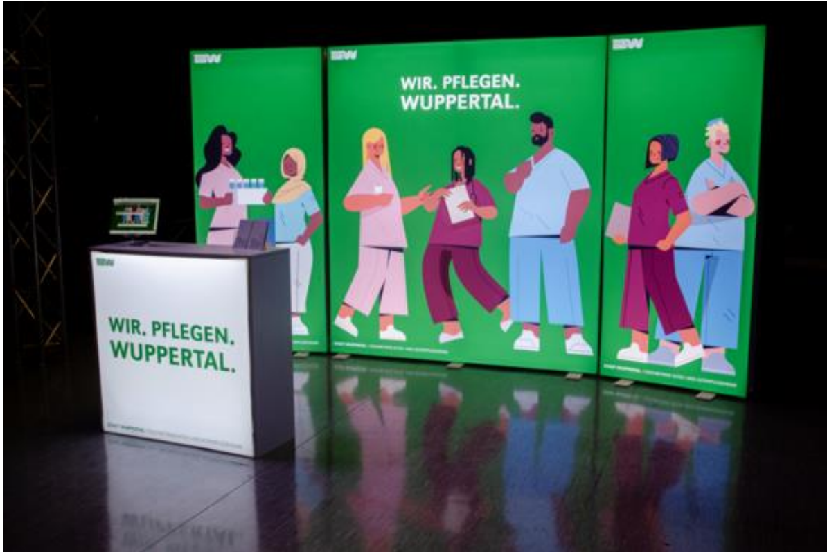
Neuer Messestand begeistert bei Wuppertal Works