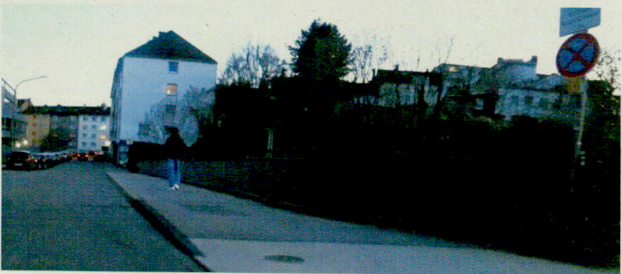
Bild 5: Blickrichtung Süd mit bestehendem Zeichen 283-30 Absolutes Haltverbot (Mitte), Aufstellung rechts über die Brücke hinweg...