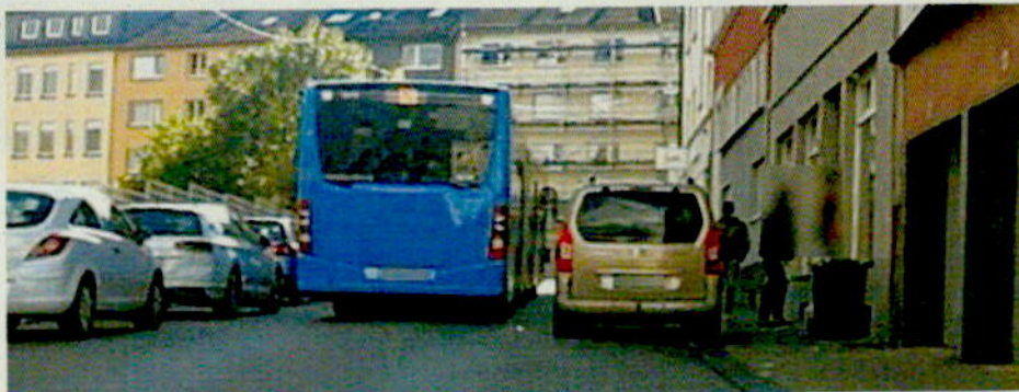
Bild 2: Blick nach Süden. Auch hier wieder gehwegparkende Fahrzeuge und kaum Platz zum Vorbeifahren.