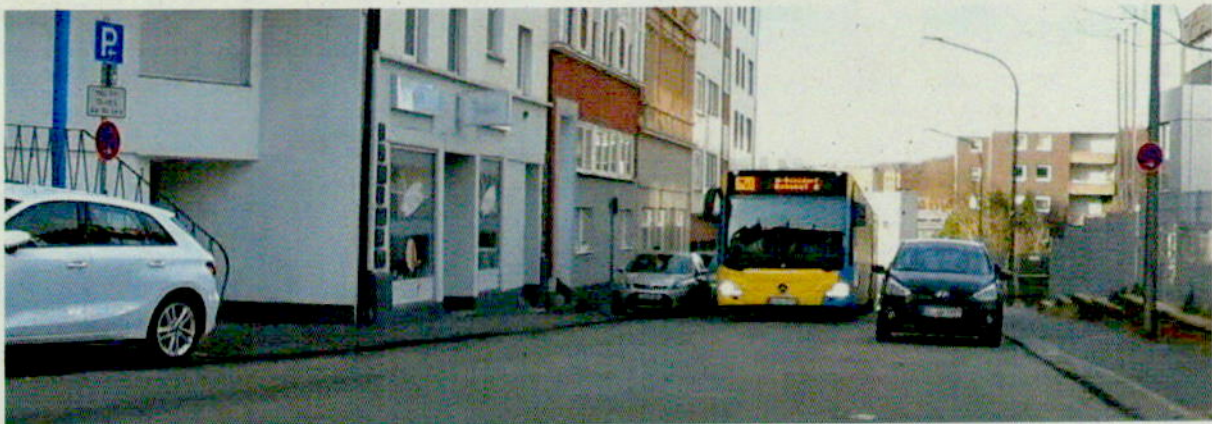
Bild 1: Blick von Süden Richtung Dessauerbrücke. Links vor Nr. 5 ist bereits ein Haltverbot eingerichtet.

Dies ist auch im Interesse einer schnellen Erreichbarkeit der Südstadt für Rettungskräfte und Feuerwehr über die Dessauerstraße.