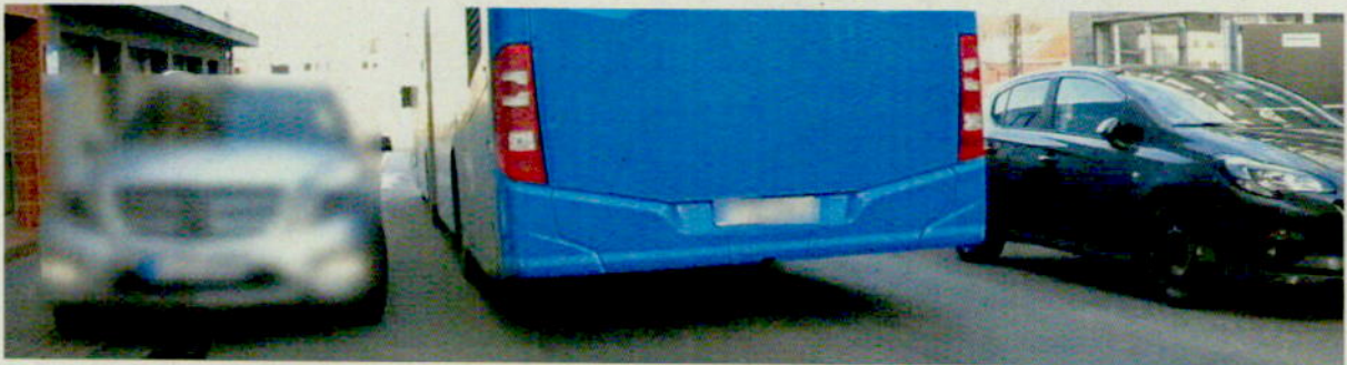
Bild 4: Südwärts fahrender PKW muß auf den Gehweg ausweichen, damit der Bus in Gegenrichtung passieren kann.