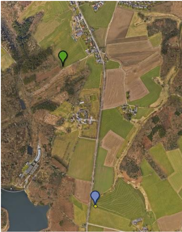
Grüner Punkt - beantragter Standort Herbringhausen 2022 Blauer Punkt - beantragter Standort Spiekern 2021