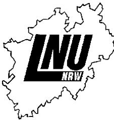
LNU Kreis Wuppertal