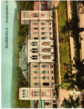
1. Zooerweiterung und innere Zoontwicklung, Zooeingang