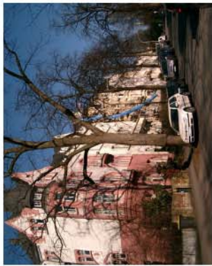
3. Lehrpfad Zooviertel