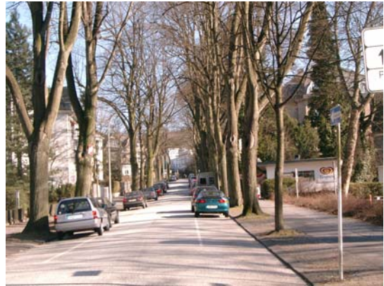
Hubertusallee mit Zoogastronomie im Hintergrund

Parallel zur Wupper soll an der Westseite des Stadions eine Uferpromenade entwickelt werden, die sich im weiteren Verlauf über die vorhandene Wupperbrücke nördlich der Wupper bis zum Bayer Sportpark fortführen lässt. Eine erlebnisreiche Verbindung entlang der Wupper ermöglicht die Entdeckung unterschiedlicher Orte: Kirche, Stadion, Felsen, Brücken stellen wichtige Blickbeziehungen dar, die es zu berücksichtigen gilt.