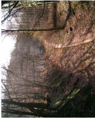
2. Samba - Fuß- und Radweg