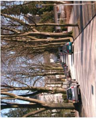
5. Wege, Plätze, ruhender Verkehr