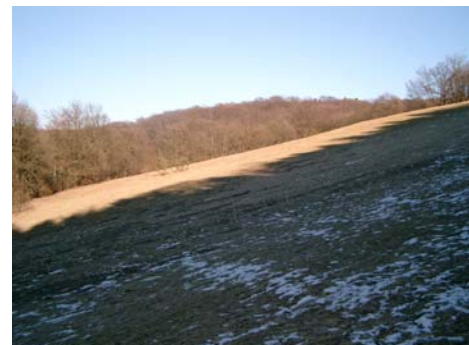
Blick auf das Erweiterungsgebiet des Zoos

Die Zooerweiterung soll ein Freigehege für Löwen (ca. 12.000 qm) und ein Freigehege für Tiger (ca. 6.000 qm) aufnehmen. Erwartet werden im Rahmen des Wettbewerbs planerische Aussagen zur Anlage, Platzierung und Gestaltung der Freiflächen, Gehegeabgrenzungen und Wege. Berücksichtigt werden soll eine Einsehbarkeit der Gehege von den Tiefpunkten unter Einbeziehung der besonderen topografischen Situation sowie eines Aussichtsturmes, um die Einsehbarkeit zu verbessern. Auch Teile der Gebäude müssen für Besucher zugänglich sein. Zusätzlich ist eine neue Toilettenanlage in Kombination mit einem Kiosk vorzusehen.