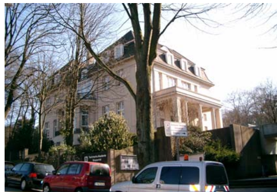
Technische Akademie im Zooviertel

Vorgesehen ist nach den derzeitigen Überlegungen eine Einrichtung mit ca. 175 Betten und einer Gesamt-Bruttogeschossfläche von ca. 3.250 bis 3.500 qm. Im Rahmen des laufenden Wettbewerbs wird geprüft, ob und ggf. wo und wie solch ein Standort innerhalb des Wettbewerbsgebiets angeordnet und integriert werden kann. Dabei scheint ein Standort auf bisher unbebauten Flächen innerhalb des Zooviertels aufgrund der Unverträglichkeit mit den angrenzenden Wohnnutzungen ebenso ausgeschlossen wie der Standort zwischen Schwebebahnhaltestelle und Stadion aufgrund der geringen Flächenverfügbarkeit und vielfältigen verkehrlichen Ansprüche (Promenade, Zufahrt Stadion). Favorisiert wird ein Standort am Boettinger Weg - kollidiert hier jedoch mit den Parkplatzansprüchen.