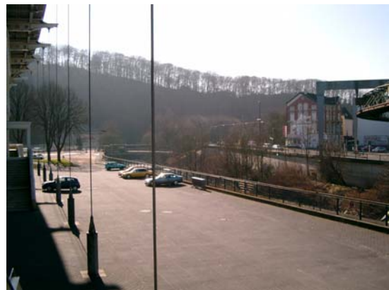
Zwischen Stadion und Wupper, Bereich der künftigen Uferpromenade

Parallel zur Wupper soll an der Westseite des Stadions eine Uferpromenade entwickelt werden, die sich im weiteren Verlauf über die vorhandene Wupperbrücke nördlich der Wupper bis zum Bayer Sportpark fortführen lässt. Eine erlebnisreiche Verbindung entlang der Wupper ermöglicht die Entdeckung unterschiedlicher Orte: Kirche, Stadion, Felsen, Brücken stellen wichtige Blickbeziehungen dar, die es zu berücksichtigen gilt.