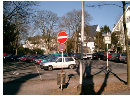
Parkplatz Hubertusallee /Annenstraße