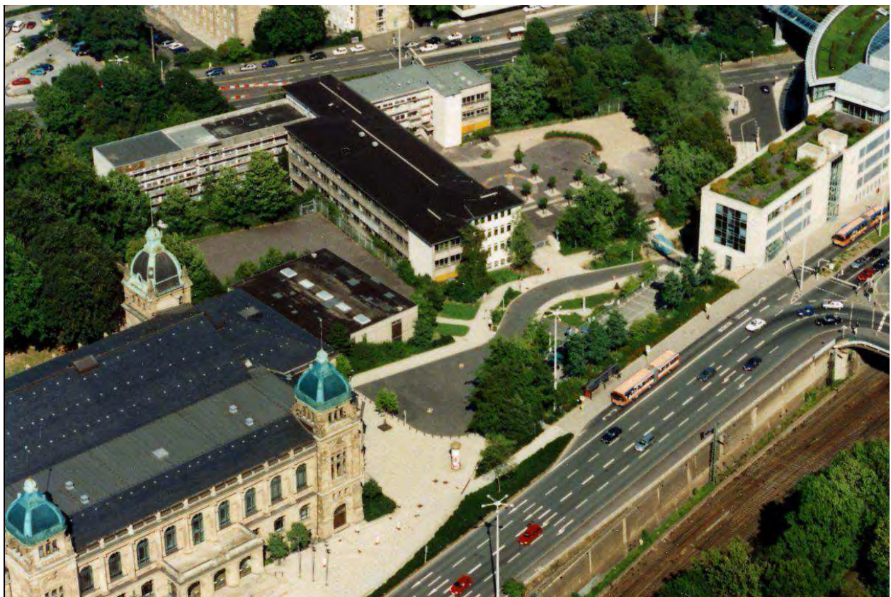
v.l.n.r.: Historische Stadthalle, Wilhelm-Dörpfeld-Gymnasium, Neubau der Stadtsparkasse, oben rechts am Schulgebäude fehlt die noch die Aula von 2007

Das Walter-Hammer-Ufer, das sehr steile und hohe Wupperufer an der Gesundheitsstraße, ist vor einigen Jahren mit kommunalen Mitteln aufwendig saniert worden. Neben den Mauersanierungen ist der Baumbestand zurückgenommen worden, so dass jetzt schöne Blickbeziehungen auf den Fluss und das Luisenviertel bestehen.