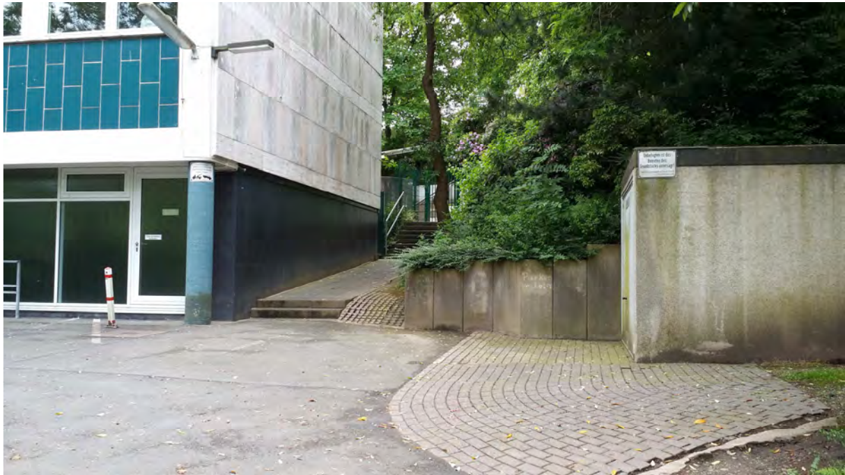
Links: geplanter Eingang des Multifunktionsraumes, Mitte: Zugang zum Haupteingang der Schule über enge Treppe für 50 v.H. der Schüler/innen und Besuchenden, geplanter neuer ‚Stadtplatz‘ mit Beseitigung der Fertigteilgarage und Umwandlung der Böschungflächen