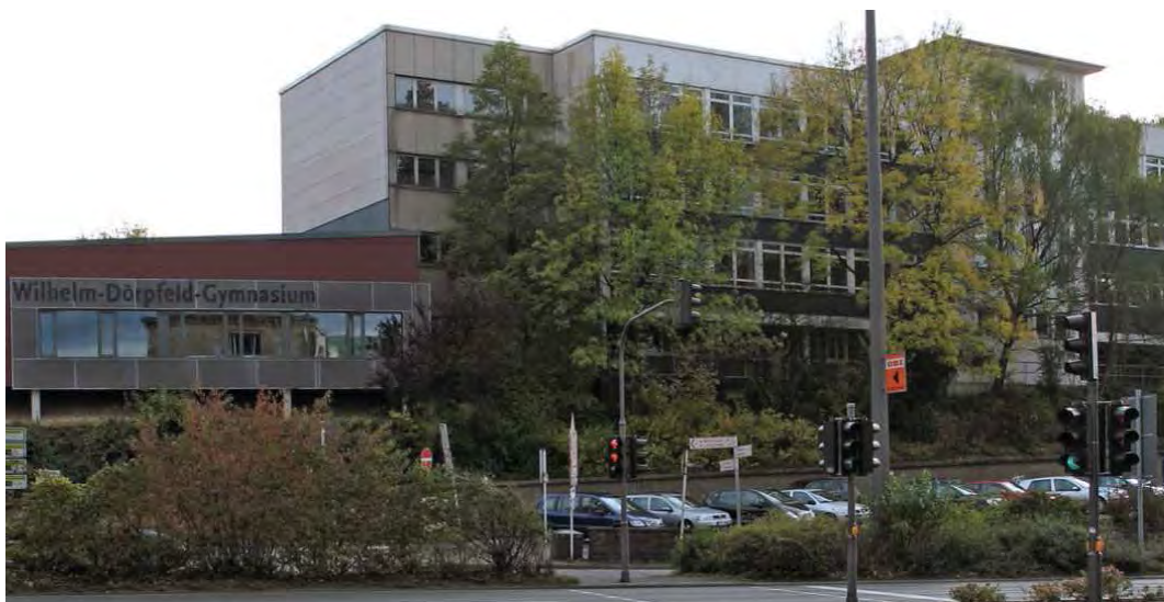
Ansicht der Schule von der Bundesallee(B7), links Neubau der Aula von 2007

Mit der Nordfassade präsentiert sich das Schulgebäude zur Bundesallee (B7) und der Schwebebahn. Während die 2007 erbaute, bordeaux-rot gestaltete Aula, die gut lesbar den Namen der Schule als Schriftzug trägt, deutlich zu erkennen ist, wird die Hauptfassadenfront von Bäumen stark verdeckt. Im Rahmen der Maßnahme soll ein Farbkonzept für die neue Fassade entwickelt werden. Über eine Auslichtung des Baumbestandes soll das sanierte Schulgebäude gut sichtbar werden und sich als attraktive Bildungseinrichtung des Quartiers präsentieren.