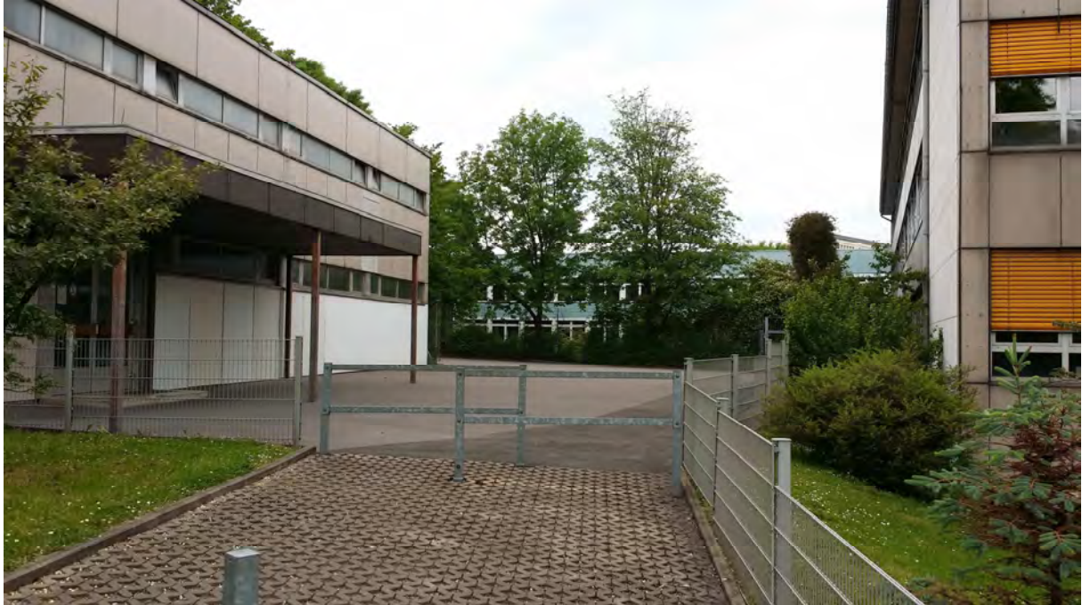
Barrierefreier Eingangsbereich von der Straße Johannisberg