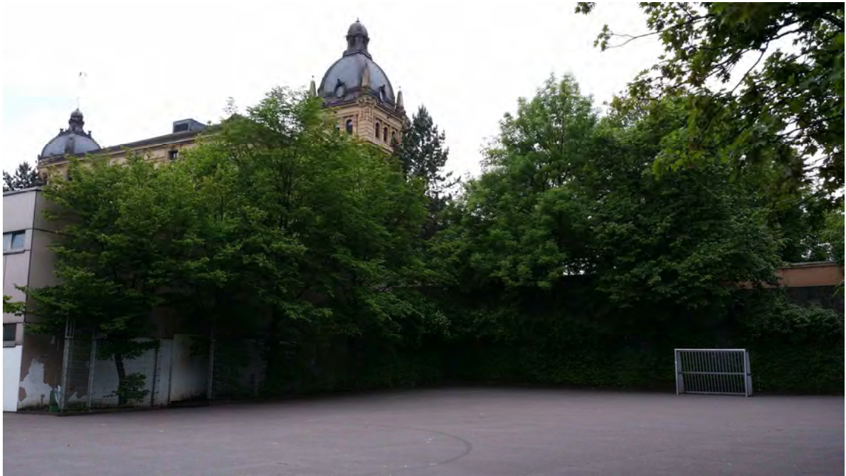
Links an der Turnhalle: geplante Boulder-Wand, Mitte und rechts: geplanter Bolzplatz