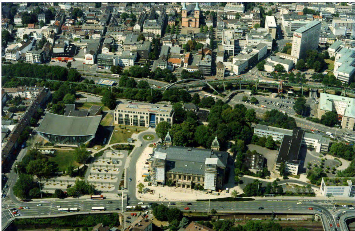
v.l.n.r.: Schwimmpfer, Hotel am Johannisberg, Historische Stadthalle, Wilhelm-Dörpfeld-Gymnasium

Mit der Erweiterung wird das Wilhelm-Dörpfeld-Gymnasium in den Satzungsgebiet einbezogen. Die Schule ist mit ihrem engagierten Schulleben fest in das Quartier integriert. Die Außenflächen sind für den Stadtteil geöffnet und werden bereits intensiv genutzt.