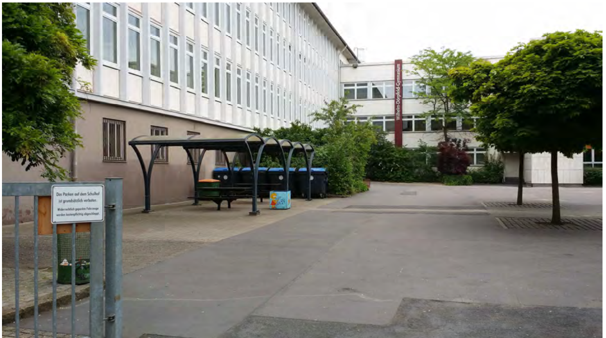
Eingangsbereich, links am Gebäude Eingang des geplanten Stadtteilcafés Bildmitte. Nicht erkennbarer Haupteingang