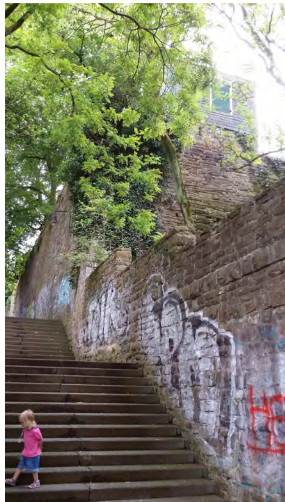
Historischer Treppenaufgang, oben: Gartenhäuschen des Stadthallen-Gartens, Verbesserung der Aussicht und der Blickbeziehungen durch geplante Maßnahme