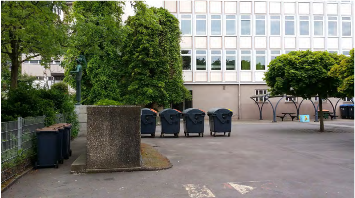
Eingangsbereich mit Pallas Athene-Skulptur und Entsorgungsbereich

Der Schulhof ist bereits heute außerhalb der Schulzeiten geöffnet. Die neugestaltete Fläche wird täglich geöffnet sein und nur in der Nacht verschlossen.