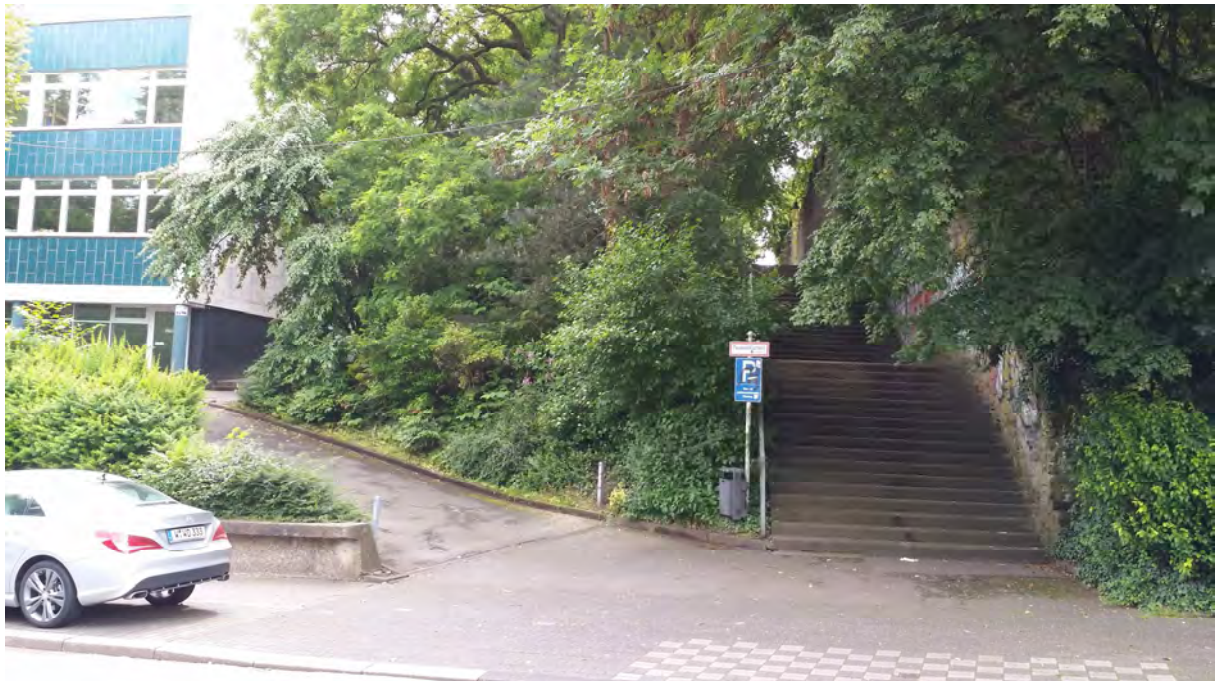
Links: Zufahrt zu den Stellplätzen, geplanter Eingang des Multifunktionsraumes, rechts: historischer Treppen-Aufgang zur Stadthalle