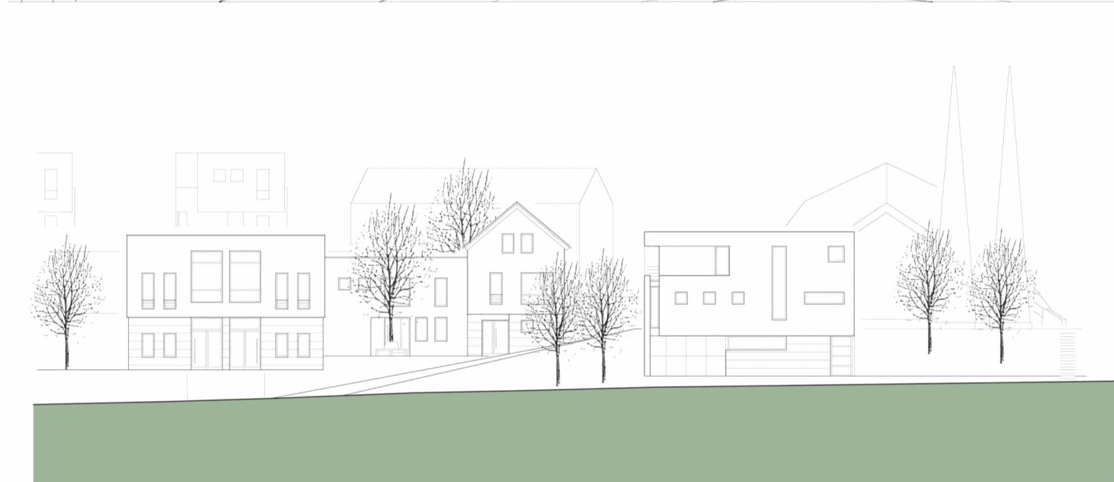
Südsicht / Deckershäuschen