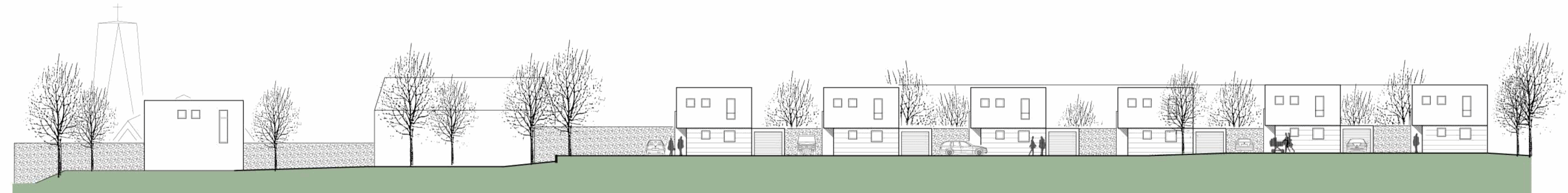
Nordsicht / Hans- Böckler- Strasse

Verfahrensstand: 1. Offenlegung (§ 3(2) BauGB) vom 00.00.2013 bis 00.00.2013