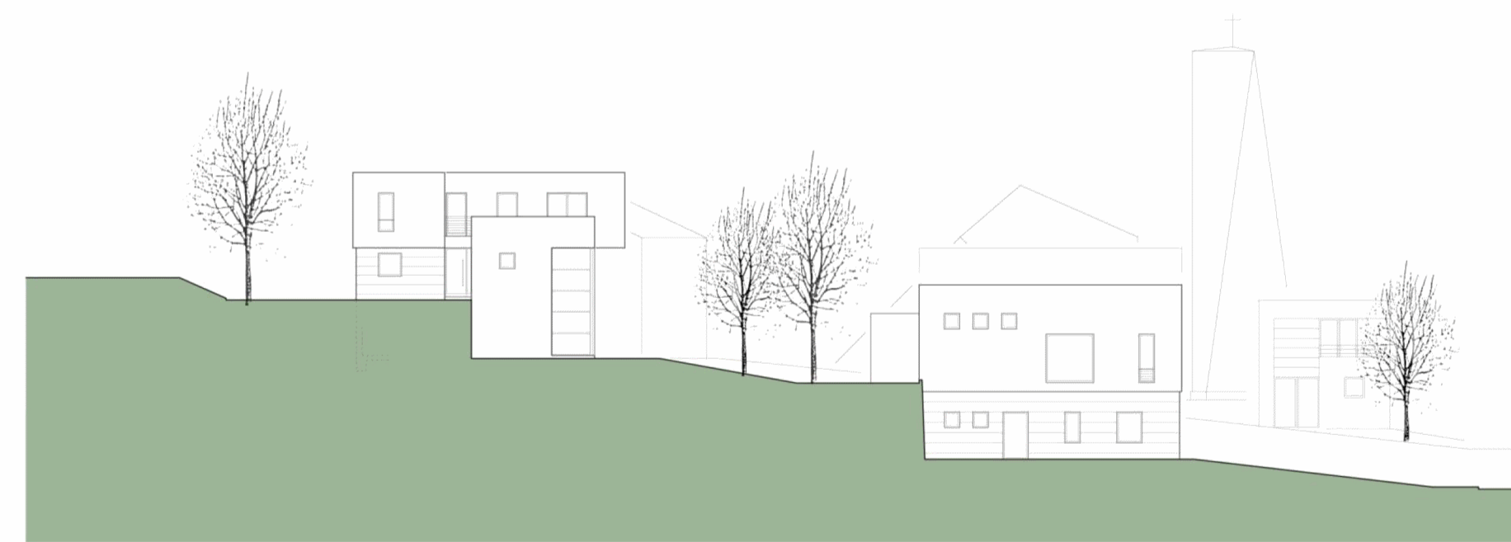
Schnitt A - A