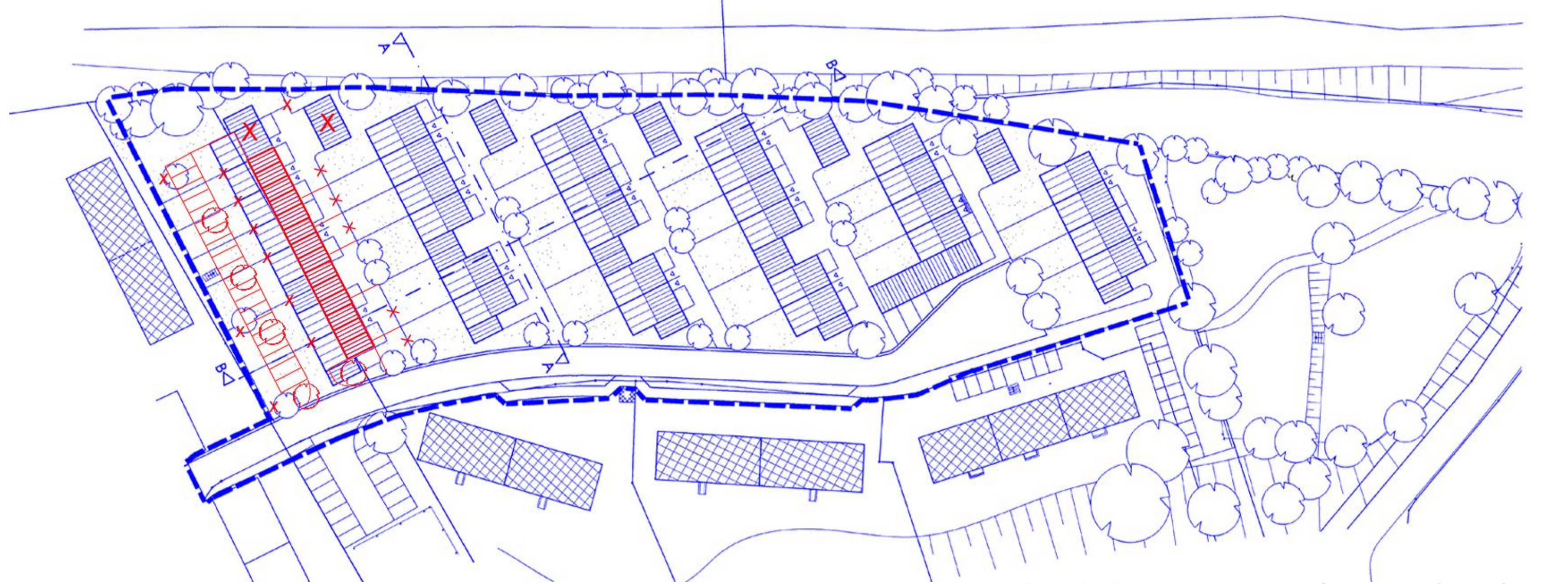
Hinweisliche Eintragung (ohne Maßstab)