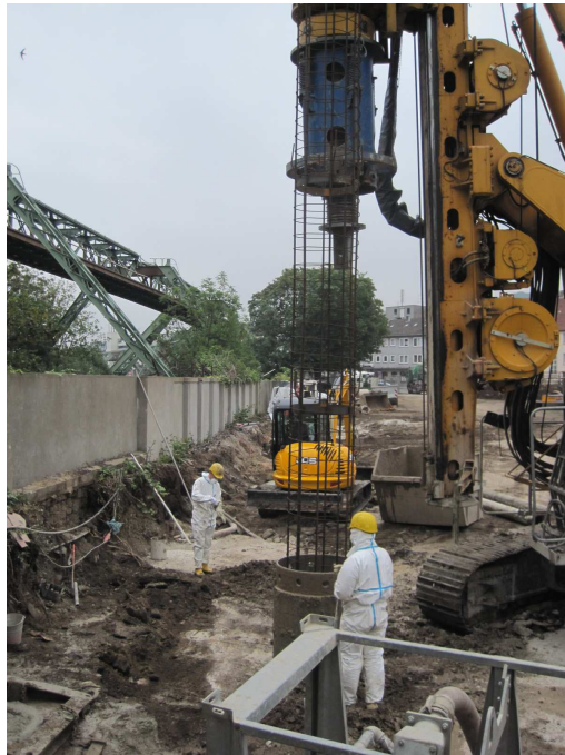
Errichtung der tangierenden Bohrpfehlwände zur Sicherung der Fundamente der Schwebebahnstützen