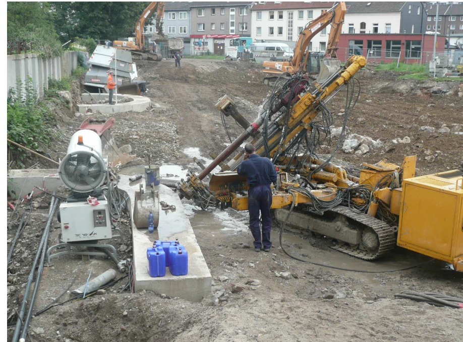
Bohrung zur Verankerung der Bohrpfehlwand im Festgestein