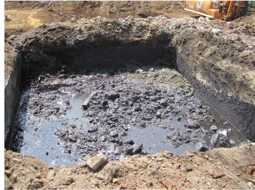
Teerbecken unterhalb des ehemaligen Retortenhauses