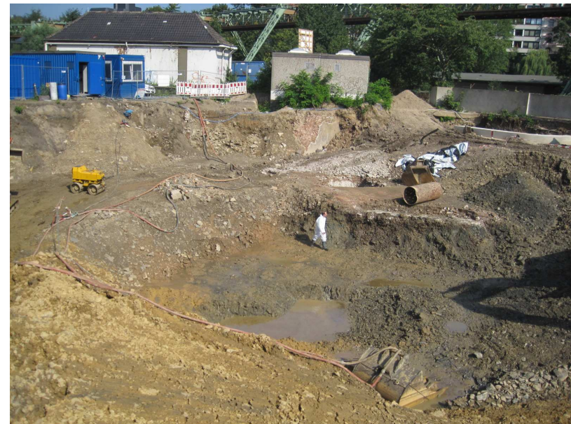
Fläche nach Beseitigung der Teerbecken