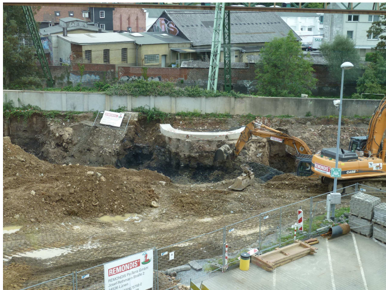
Restbelastung an der Wuppermauer